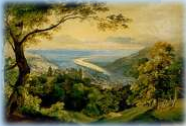
Heidelberg - Carl Rottmann, 1815

Ya sea con el casco antiguo de Heidelberg o con el castillo, uno se encuentra en cada rincón con un poco de historia. La ciudad, con la universidad más antigua de Alemania (fundada en 1386), se remonta a una historia de 800 años. En este tiempo la ciudad atrajo a poetas como Goethe, Eichendorff y Mark Twain; artistas conocidos como Turner, Fohr y Trübner se dejaron inspirar por sus coloridas impresiones; y compositores como Brahms, Schumann o Carl Maria von Weber